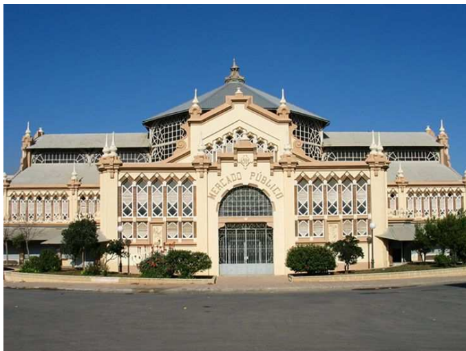
Antiguo Mercado de Abastos