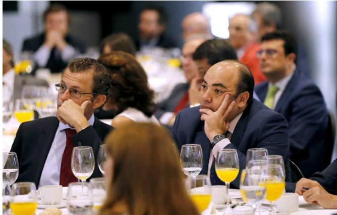
Presentación del Pulsímetro Inmobiliario Córdoba