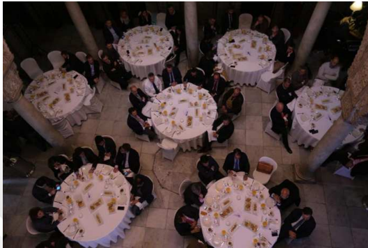
Presentación del Pulsímetro Inmobiliario Cádiz