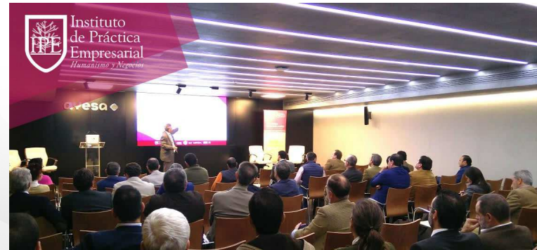
Presentación del Pulsímetro Inmobiliario Sevilla