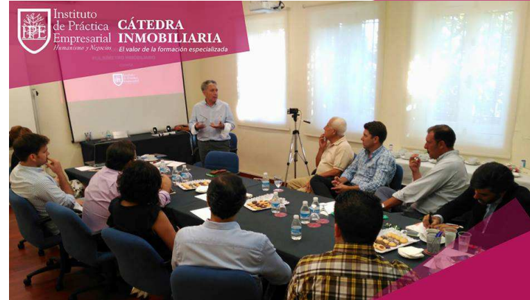
Presentación del Pulsímetro Inmobiliario Málaga